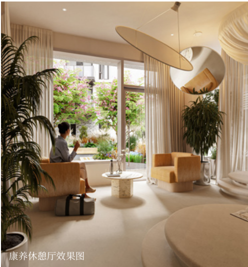
康养休憩厅效果图