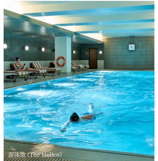
游泳池 (The Helios)