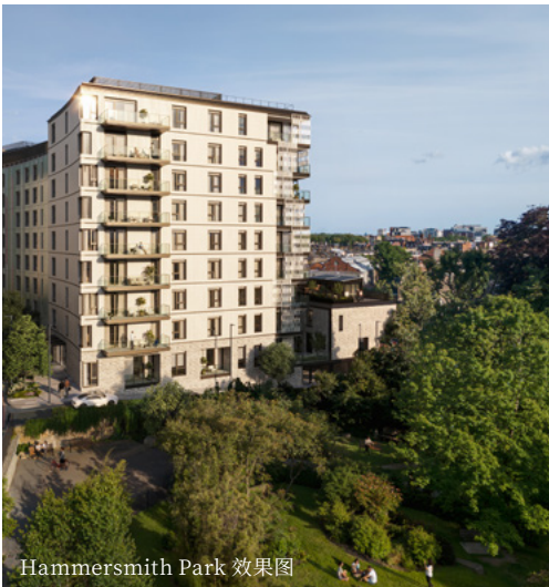
Hammersmith Park 效果图