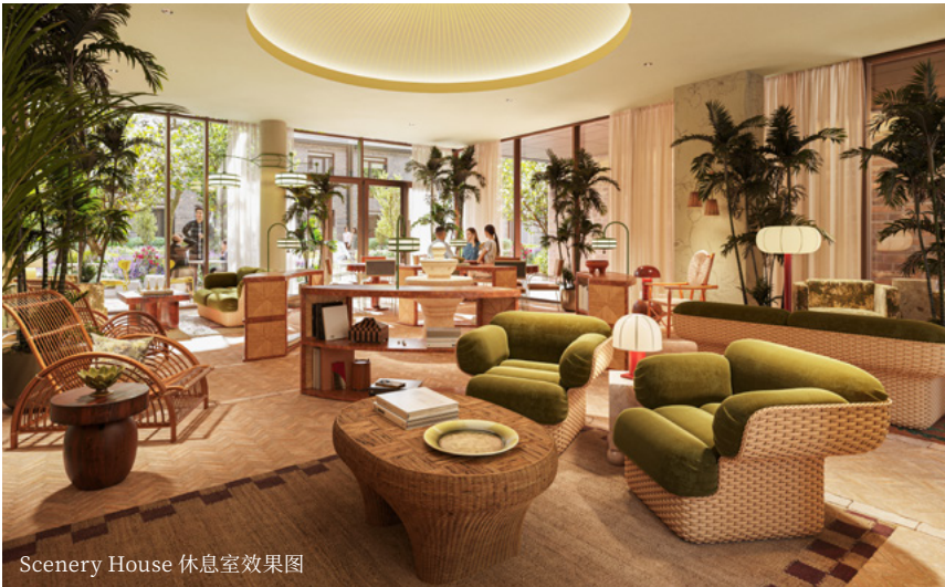
Scenery House 休息室效果图