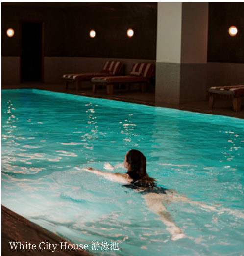
White City House 游泳池