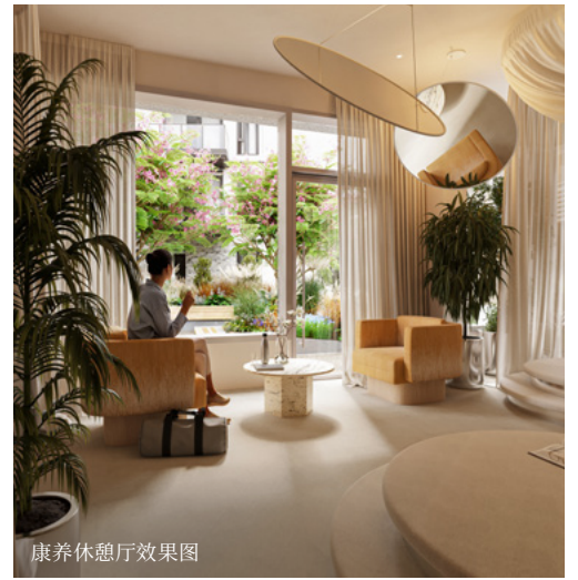
康养休憩厅效果图