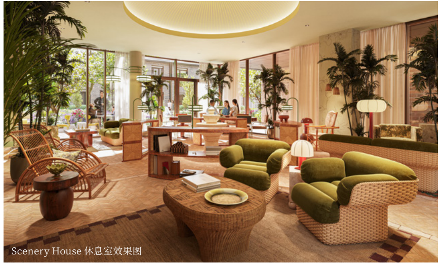
Scenery House 休息室效果图